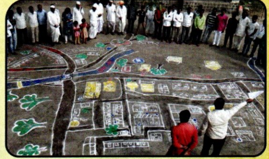
ग्रामीण शिबीर या उपक्रमांतर्गत पी.आर.ए. करतांना विद्यार्थी प्राध्यापक आणि ग्रामस्थ