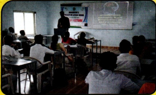
मानसिक आरोग्याबाबत तज्ञाकडून विद्यार्थ्यांना मार्गदर्शन