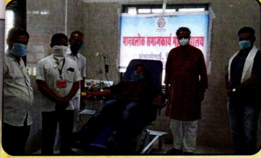
रक्तदान हे श्रेष्ठदान