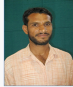
Babasaheb Limbaji Bhalerao